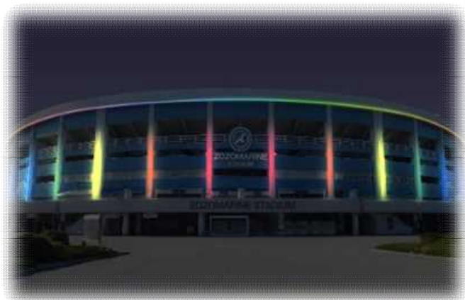
外壁ライトアップ